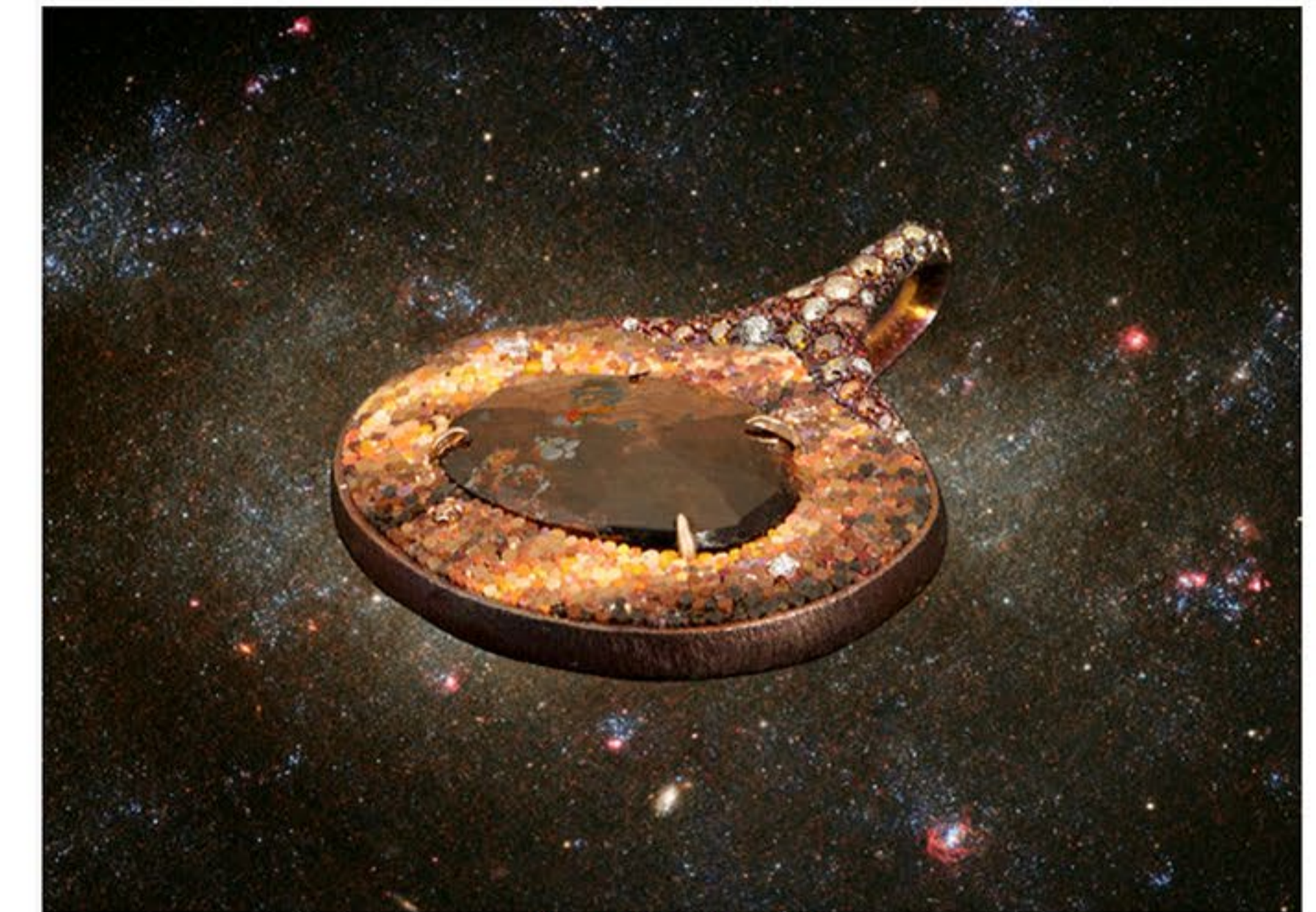
Ganymède © Le Sibille

Ici, or rose et blanc côtoient titane et rhodolite, les bijoux brillent imperceptiblement tel des fragments de météorites lointains. Sublimées par un travail d'orfèvrerie méticuleux, chaque pièce devient l'occasion de contempler l'univers dans tous ses détails, notre œil devenant un télescope explorant des rivages parsemés d'étoiles. Un des bijoux "le trou noir" épaté notamment. Torsadé, il concentre en son centre une pluie scintillante de pierres précieuses et suinte le mystère.