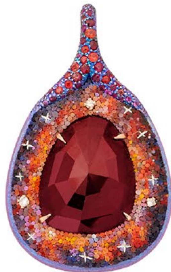
Bague Vénus et Pendentif Vénus : Or rose 18KT, titane, tranche de rhodolite, diamants, rubis, saphirs orange, galaxie micromosaïque cinétique

Perpétuant l'ancienne tradition de la micro mosaïque, la marque de joaillerie dévoile huit pièces en or rose et blanc, titane et rhodolite ornées de micro mosaïques, diamants, rubis, saphirs orange et or, opale Boulder d'Australie et opale Matrix Fire du Mexique, minutieusement confectionnées à Atelier Le Sibille par des artisans romains.