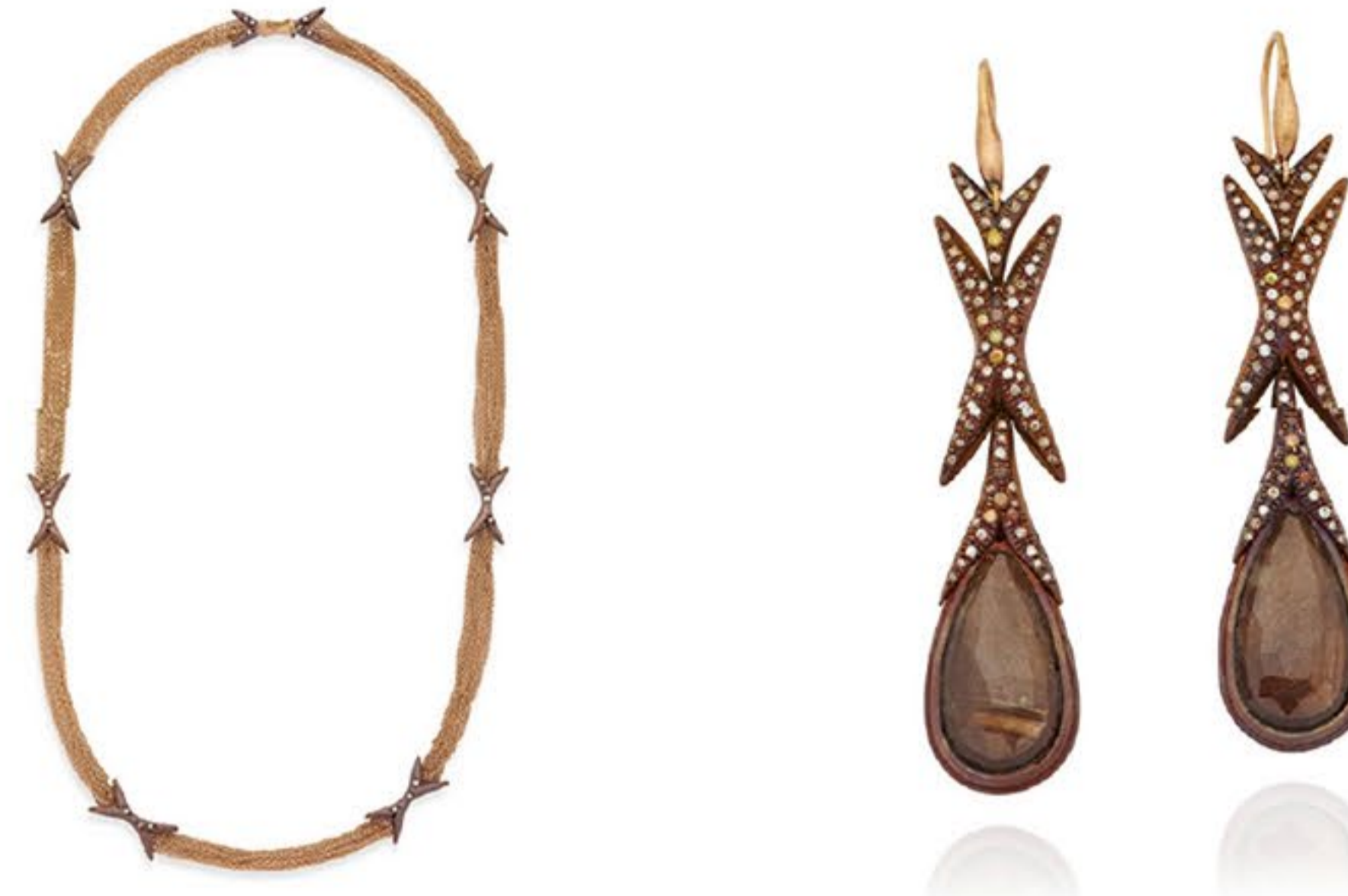
Collier Ganimède : Or rose 18KT, titane, diamants - Boucles d'oreilles Ganimède : Or rose 18KT, titane, diamants, saphirs gouttes d'or