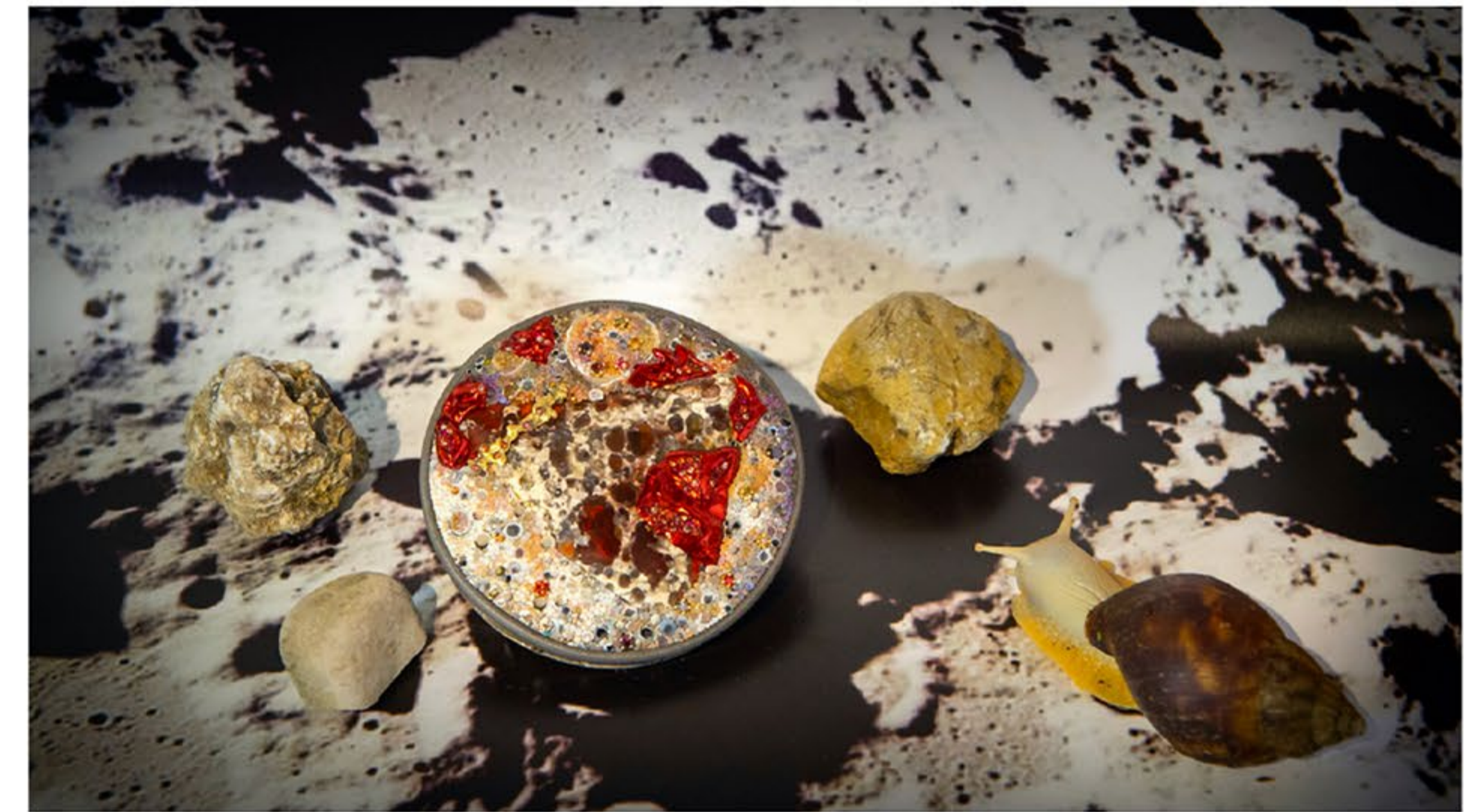
Broche Pendentif Planète : Or blanc et jaune 18KT, titane, diamants, rubis, saphirs orange, opale de feu Matrix du Mexique

La marque Le Sibille se situe entre l'Antiquité et la Renaissance, les luxueux bijoux romains sont inspirés de l'histoire italienne et sont le fruit d'un travail d'orfèvre et d'une tradition millénaire : la micro-mosaïque. Le nom se réfère aux Sibylles, d'abord prêtresses d'Apollon puis, dans le monde chrétien de la fin du Moyen-Âge, elles sont les symboles de l'attente de l'avènement du Christ. Dans leur atelier de Rome, les créatrices Camilla Bronzini, Francesca Neri Serneri et Antonella Perugini font revivre des méthodes de travail ancestrales, un