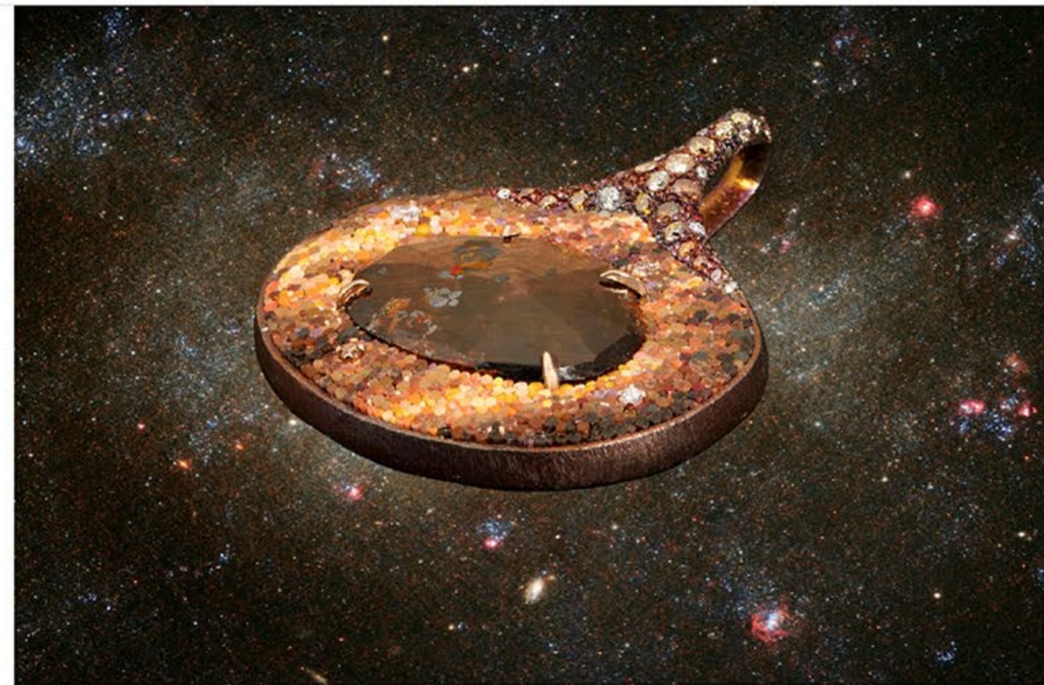
Pendentif Ganimède : Or rose 18KT, titane, saphir tranche d'or, diamants, micro mosaïque

Cette tradition s'est transmise à travers les siècles jusqu'au XIIIe siècle, où les mosaïques ont été utilisées pour remplacer les œuvres peintes, pour les préserver de la dégradation du temps et de l'humidité. Tous les bijoux sont fabriqués et fabriqués à la main à Rome, via Muzio Clementi, dans le quartier de Prati, près du Vatican. L'équipe, entièrement féminine, supervise avec soin et méthode chaque processus de production en atelier, afin de garantir l'excellence ultime de chaque pièce proposée.